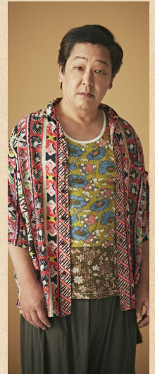
有川マコト 《小さい石》