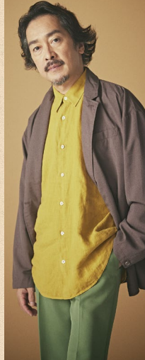
栗原英雄 《エウリディケの父》