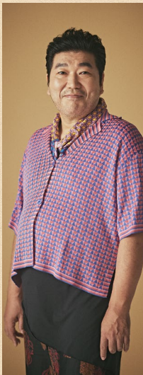
櫻井章喜 《大きい石》