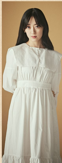
水嶋 凜 《エウリディケ》